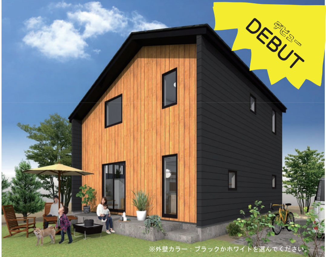
※外壁カラー：ブラックかホワイトを選んでください。